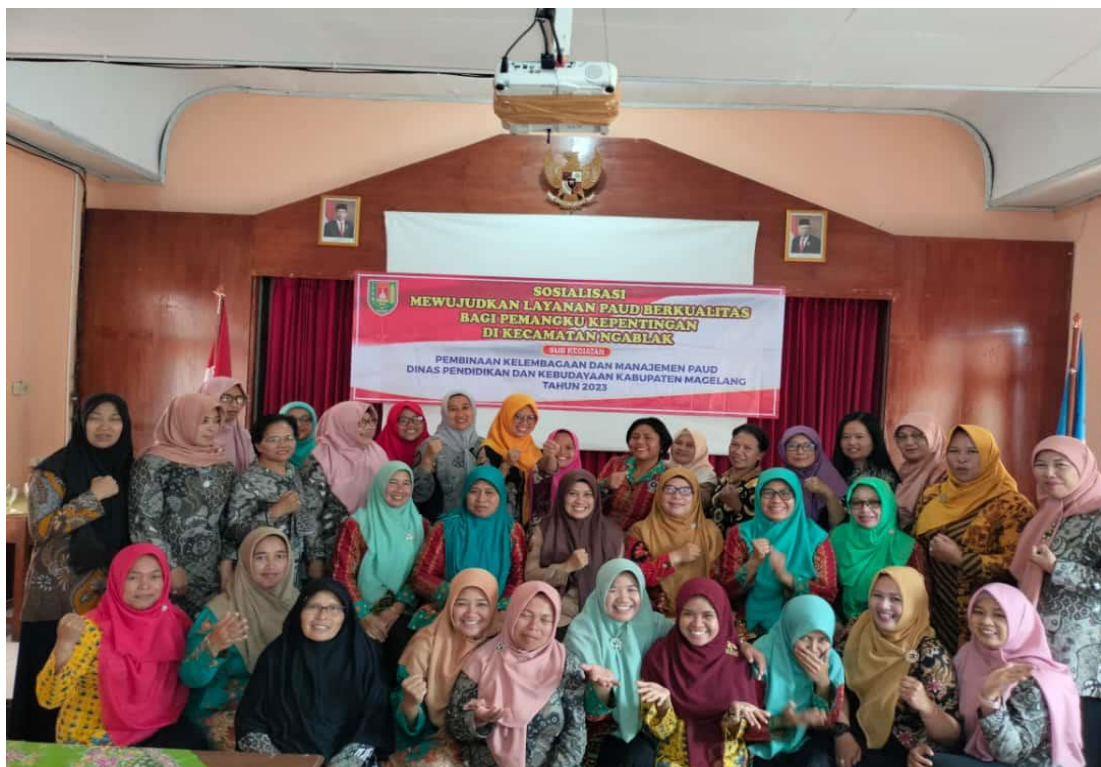
Gambar 5. Kegiatan Pembinaan Kelembagaan PAUD