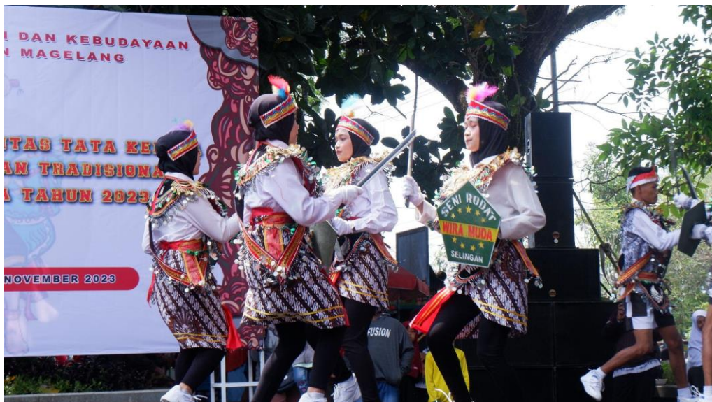
Gambar 10. Pertunjukan Kesenian Tradisional