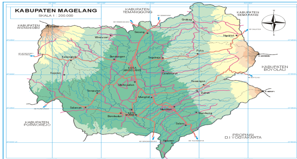
Gambar 1. Peta Wilayah Kabupaten Magelang