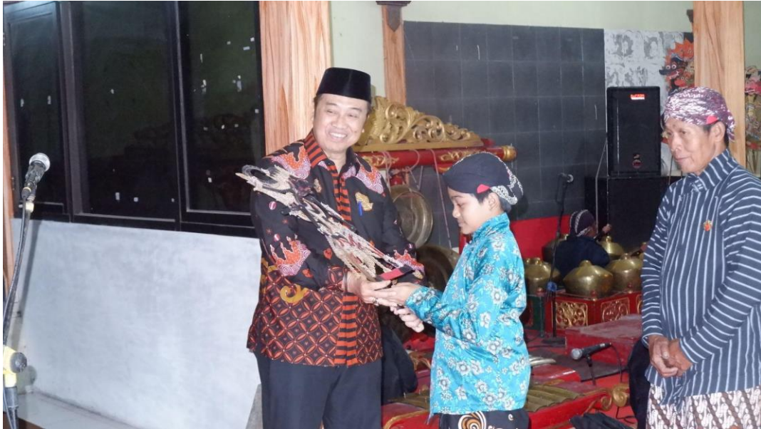
Gambar 9. Pagelaran Wayang Kulit Dalang Cilik