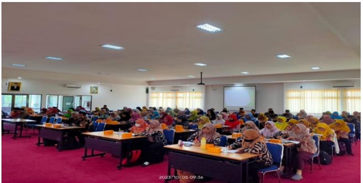
Gambar 3. Pembinaan Kepegawaian