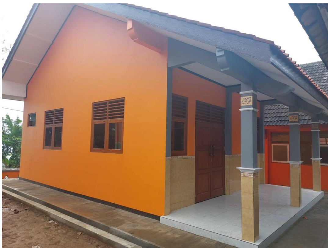
Gambar 7. Pembinaan Peran Pusat Kegiatan Belajar Masyarakat (PKBM) dan SKB dalam Program Penanganan Anak Tidak Sekolah (PATS)